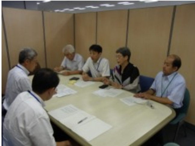
申し入れの様子(8月20日区役所)

て熱中症対策の強化を求め、要望書を提出し、低所得者世帯に対し、クーラー設置の費用や電力料金の助成などを求めました。