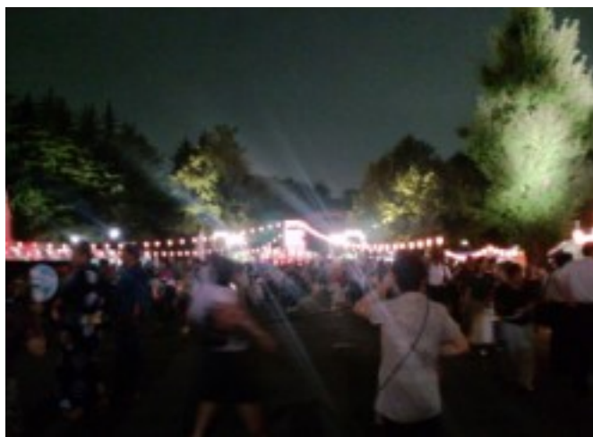
丸の内盆踊り大会(日比谷公園)

丸の内音頭大盆踊り大会 八月二〇日に日比谷公園でおこなわれました。二一日には地元の岩本町の盆踊りに参加させていただきました。