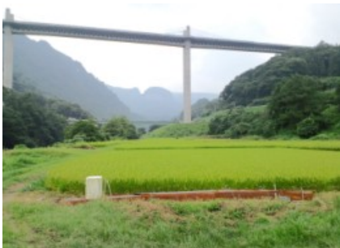
ダムができればこの田園風景も水没します

ダム周辺には昔からの温泉地や有名な渓谷があります。ダムでなくこうした観光資源を生かした村おこしの方が大事なのではないでしょうか。