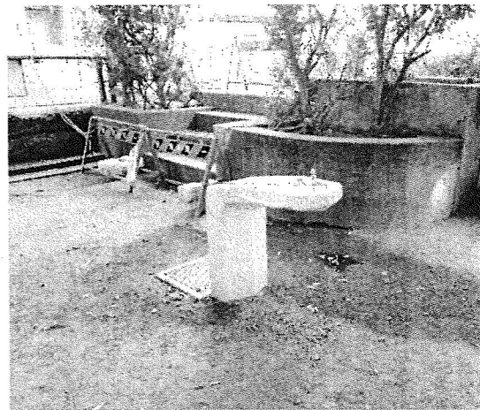
新たに設置された水飲み場

「佐久間公園から撤去された水飲み場を再び設置してほしい」という電話が事務所であり、区に伝えました。区は「要望を聞いたので設置をする」としていました。