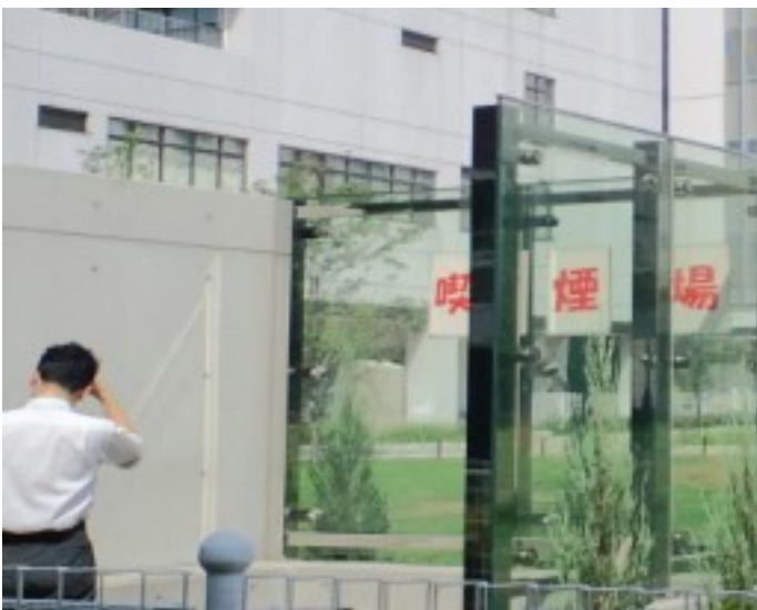
アクリル板で仕切られている喫煙スペース（和泉公園）

公園での喫煙状況の改善も一歩前進しました。公園での「喫煙は煙が周りに広がる」などの苦情がありました。喫煙スペースをアクリル板などで囲み煙が広がらないよう改修する計画です。当面、俎橋児童遊園、外堀公園が改修されます。