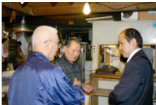
築地市場で「市場を考える会」の方にお話を聞きました(2日)

東京都民の台所であり、東京だけでなく世界的に有名な築地市場の東京ガス工場跡地（豊洲）への移転では、移転先の工場跡地で環境基準を大幅に超える土壌汚染（ベンゼン四万八千倍、シアン八百倍など）など不安を残したまま大きな問題になっています。