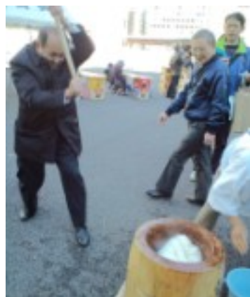
風は冷たかったですが晴れて良い日でした。久しぶりのもちつきは杵が重く、結構な力仕事でした。

党区議団は独自に購入した放射線の線量計（専門家推奨のもの）で、子育て世代のみなさんが不安に思う場所の線量の測定をおこなっています。この間も「淡路町の道路脇が雨が降るたびに水溜りができるので心配」という連絡があり測定をおこないました。測定の結果はすぐにお知らせします。心配な場所等ありましたらご連絡下さい。