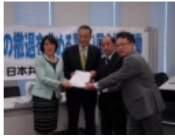
みなさんにご協力頂いた「原発からの撤退を求める署名」を国会に提出してきました(11月)