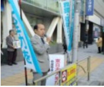
東日本大震災救援募金を連日訴えました。ご協力ありがとうございました(3月～)