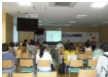
原発事故の放射能汚染で子育て世代に不安が広がりました。党区議団でパバママシンポを開き、放射能の問題を一緒に考えました(7月、10月)

二〇一一年は、千代田区議選でのご支援や東日本大震災への募金や救援物資カンパの提供、区民アンケートや署名へのご協力など様々なご協力をありがとうございました。来年も区民の願い実現にむけ全力をつくします。