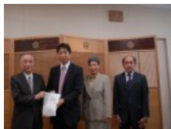
区民アンケートに寄せられたみなさんの声を来年度の予算要望にまとめ石川区長へ提出してきました(11月)