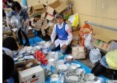
石巻市へ救援ボランティアに。支援物資の無料バザーに参加。写真の地区も1m位の浸水がありました(6月)

二〇一一年は、千代田区議選でのご支援や東日本大震災への募金や救援物資カンパの提供、区民アンケートや署名へのご協力など様々なご協力をありがとうございました。来年も区民の願い実現にむけ全力をつくします。